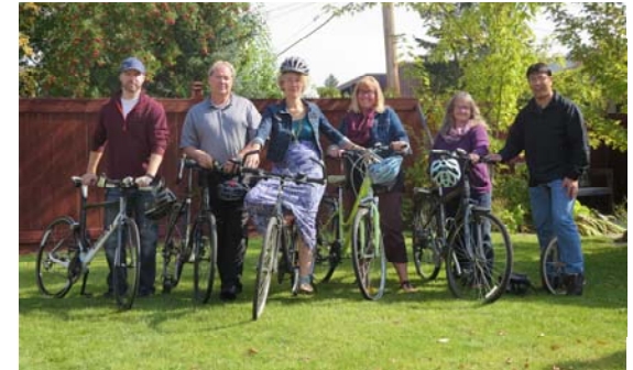
Prince George Railway and Forestry Museum

Par l'entremise de notre site web et de nos présentations, nous faisons connaître les pratiques optimales et les résultats de recherche afin d'appuyer les éducateurs et renforcer leur capacité à répondre aux besoins d'apprentissage des élèves présentant un syndrome d'alcoolisation foetale.